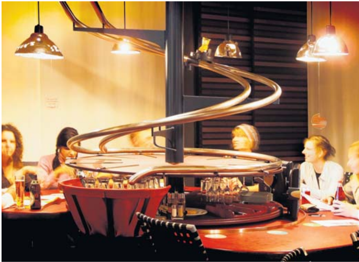
Auf das „s'BAGGERS“ in Nürnberg schaut die gastronomische Welt. Die Pluspunkte: regionale Küchenkunst, niedrige Preise, Service wie von Geisterhand.