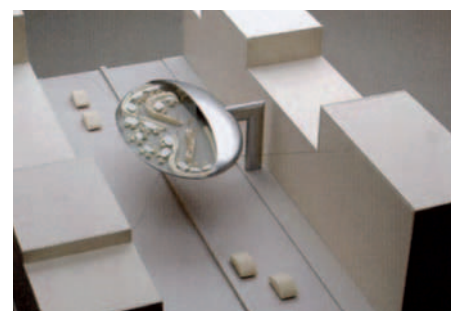
OFF ROAD von Joshua Kellner (3. Preis)