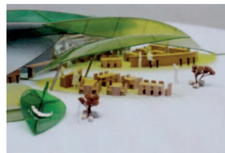
AUTUMN LEAVES von Stefan Lehmann (1. Preis)

Trend- und Szenegastronomen, die europaweit expandiert und ein Netzwerk über den Kontinent gezogen hat, hat das Patronat für den Wettbewerb übernommen.