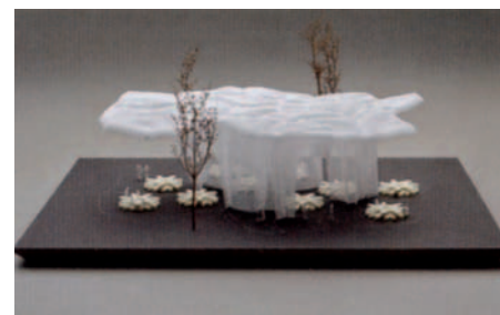
SLIP SLIDING AWAY von Nadine Schüller